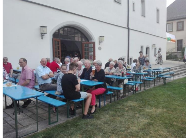
Fischgrillfest der FW Heilsbronn