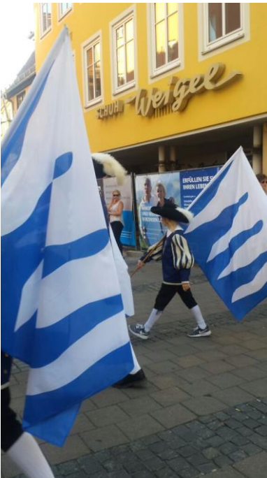
Spielmanszug auf dem Ansbacher Altstadtfest